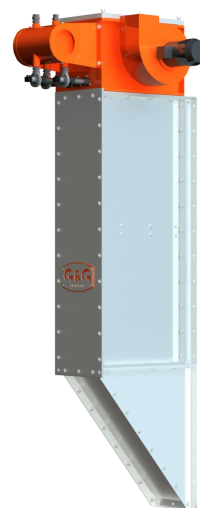
vertikalna izvedba filtra