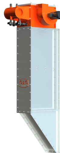
vertikalna izvedba filtra